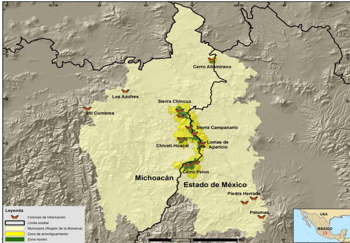
Figura 1. Lugares en donde históricamente se han documentado colonias de hibernación de la Monarca.